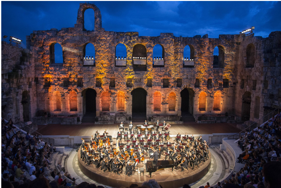
Theatern Odeon Herodes Atticus

Höhepunkte des Festivals sind Aufführungen in den beiden antiken Theatern Odeon Herodes Atticus und im antiken Theater von Epidaurus .