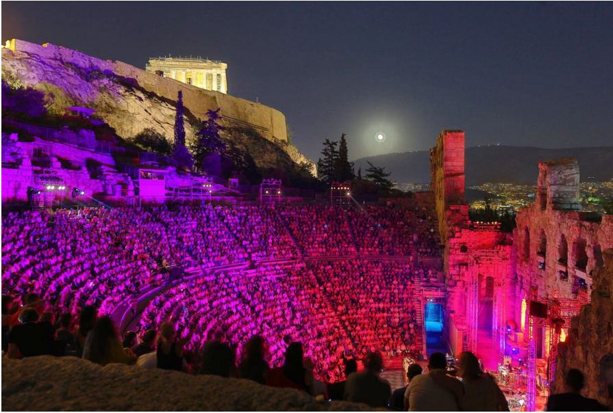
Das Odeon des Herodes Atticus während des Athens & Epidaurus Festivals.

Wenn Sie das Glück haben, Athen während des Festivals zu besuchen, sollten Sie unbedingt mindestens eine Aufführung in einem dieser antiken Theater besuchen, um ein wirklich unvergessliches Erlebnis zu erleben.