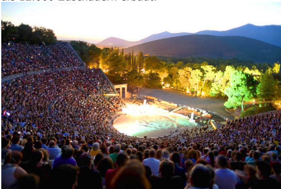
Eine Dämmerungsaufführung des griechischen Nationaltheaters während des Epidaurus-Festivals.

Das antike Theater von Epidaurus gilt als das am besten erhaltene antike Theater Griechenlands und ist berühmt für seine perfekte Akustik. Es wurde im späten 4. Jahrhundert v. Chr. mit einer Kapazität von mehr als 12.000 Zuschauern erbaut.